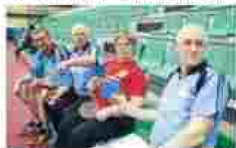
Активист СПОАО Крылья летать, Иннострурпроект профессионально бегут, которые соревнуются по плаванию в Спартакиаде ОАО СПОАО.

Пусть «стареет» давность» нанесла массовому спорту былой удачи, они не уны-