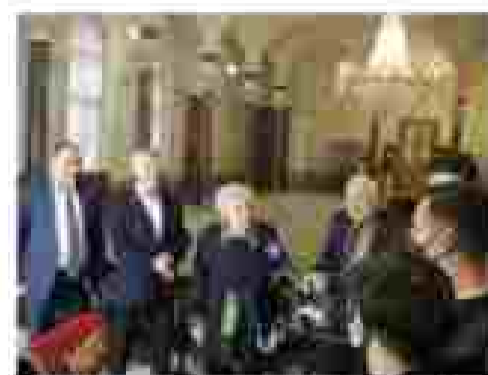
Олимпийский чемпион в составе СССР Владимир Лыбин и Олег Гудин.

Рабочий спорт воспитывает бойцовский характер, дух коллективизма, учит работ-