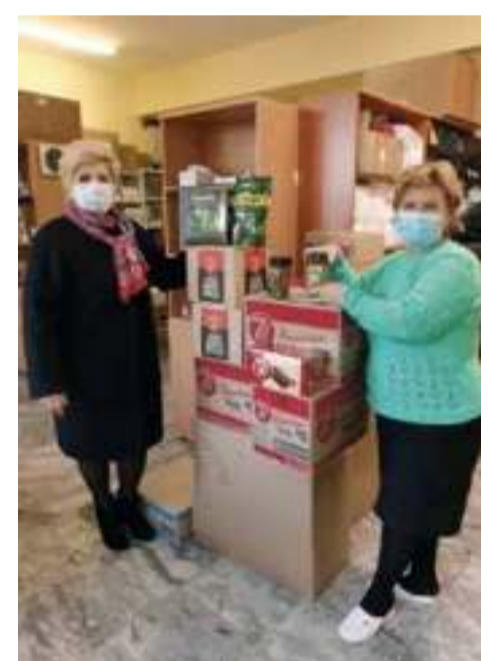
В период эпидемии профком развез сладкие подарки от Межрегиональной организации профсоюза для работников «красных зон»

«Обсуждение проекта колдоговора проходит очень бурно и заинтересованно. Каждый сотрудник может внести свои предложения, и многие пользуются этим правом. Другое дело, что не всегда есть возможность реализовать на практике те или иные пожелания. И здесь приходится искать компромисс. Но наш профком делает все возможное, чтобы круг гарантий и льгот не только не сужался, но и расширялся».