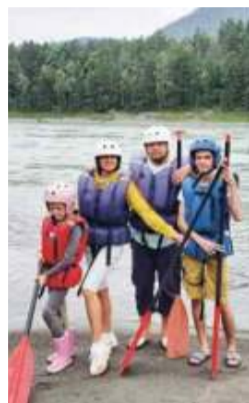
С семьей на реке Катунь (Алтай)

Ну а в свободную минуту одно из увлечений – кулинария, приготовление различных блюд вплоть до самых экзотических. Также профлидер любит путешествовать вместе с семьей, открывая для себя новые места на карте России.