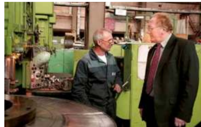
Профлидер в цехе Ленинградского Металлического завода

в два года оплачиваются двухнедельные путевки в санатории, пансионаты и на базы отдыха. Работникам возвращается до 70 процентов стоимости санаторно-курортного лечения. Особые льготы на приобретение путевок по медицинским показаниям предусмотрены для работников, чей труд связан с вредными условиями. Им компенсируют до 90 процентов стоимости путевки.