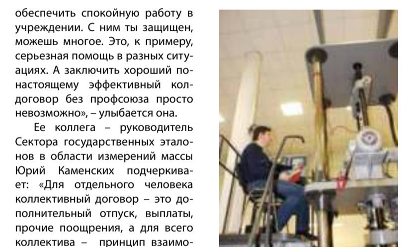
Работа с эталоном единицы силы

ФГУП «ВНИИМ имени Д.И.Менделеева» – федеральный научный центр, который в этом году отметил свое 180-летие. На сегодняшний день этот институт – один из ведущих научных центров в стране в области метрологии, в его составе два филиала – на Урале и в Казани. Общая численность сотрудников свыше тысячи человек.