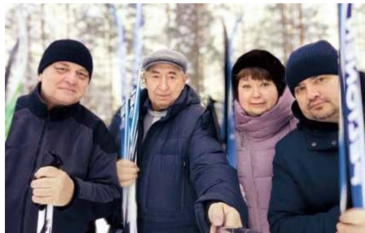
Состязания по лыжам. Спартакиада Территориальной организации Российского профсоюза работников судостроения